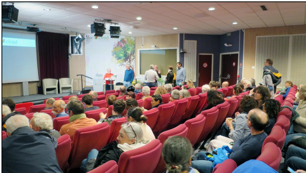
5 L'amphithéâtre se remplit.