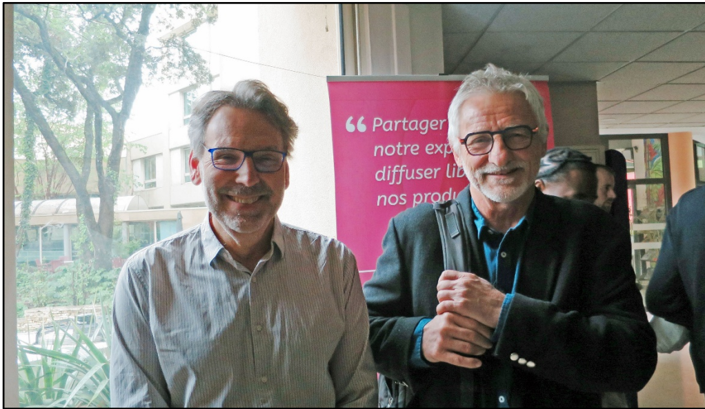
1 Les deux vedettes.