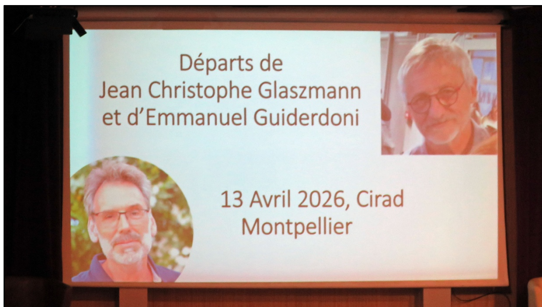
6 Début des présentations.