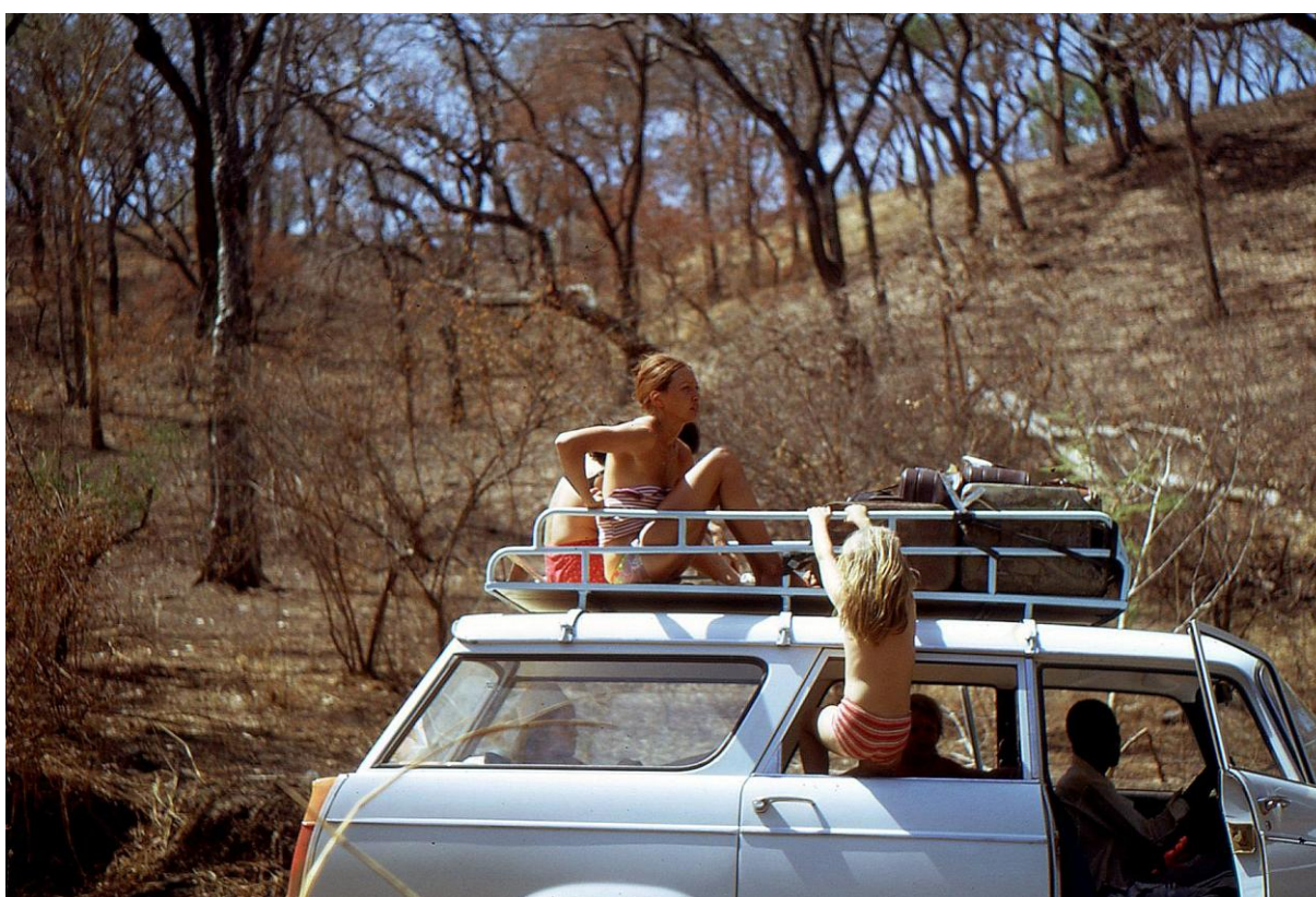
Il Cam 3.11 : pause exceptionnelle pour changer d'air et pour essayer de bronzer (PLB, 1974).