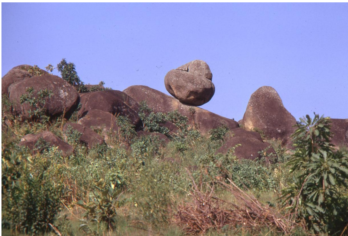
Il Cam 3.13 : le rocher arrondi en équilibre qui aurait donné, en langue Mboum locale, son nom à Ngaoundéré, « Montagne au nombril » (massif de l'Adamaoua) (1974),