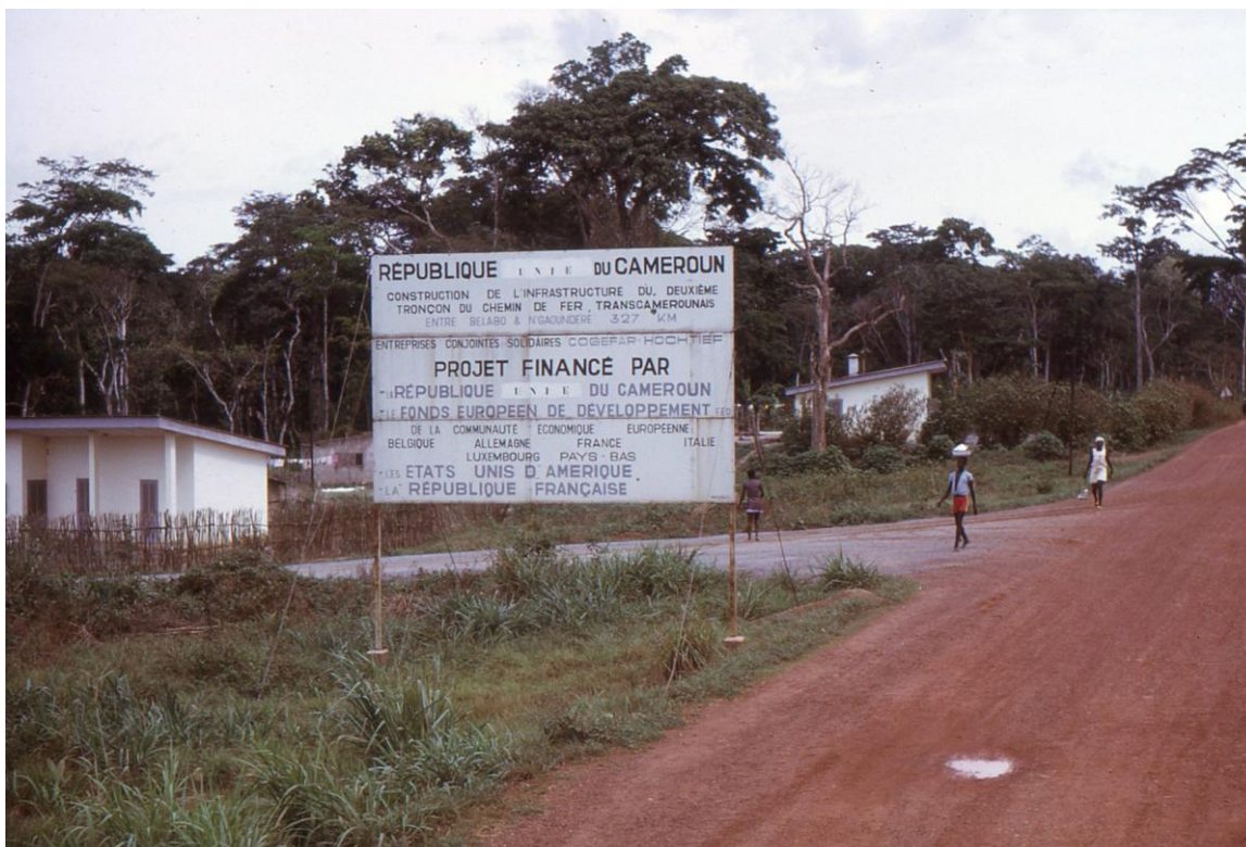
II Cam 3.02 : début de piste, au nord de Ngaoundéré, pour atteindre le « Parc de La Bénoué » (PLB) à 150 km dans le département Mayo-Rey de la région Nord qui est limitrophe à la région Adamaoua (1974).