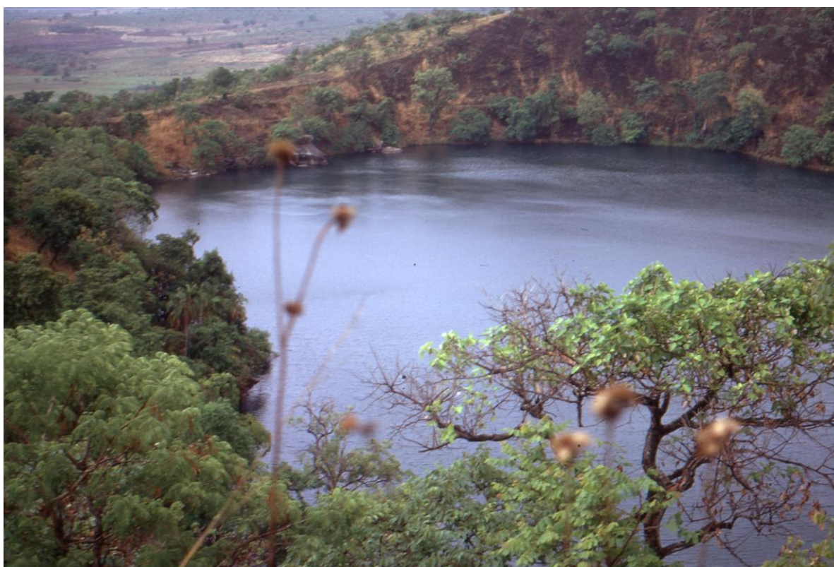
Il Cam 3.14 : le lac de cratère Tison à l'est de Ngaoundéré (massif de l'Adamaoua) (1974)