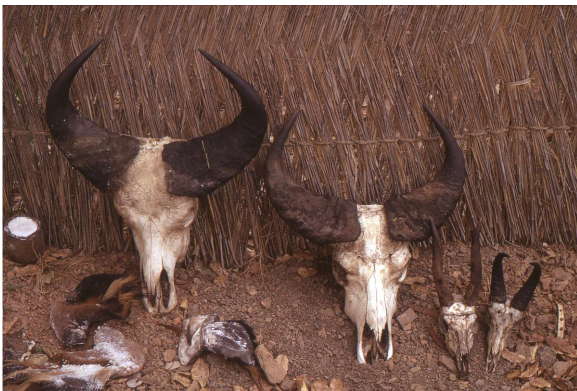
Il Cam 3.05 : trophées, campement du « Buffle Noir » et aussi, réserve de chasse (PLB, 1974).