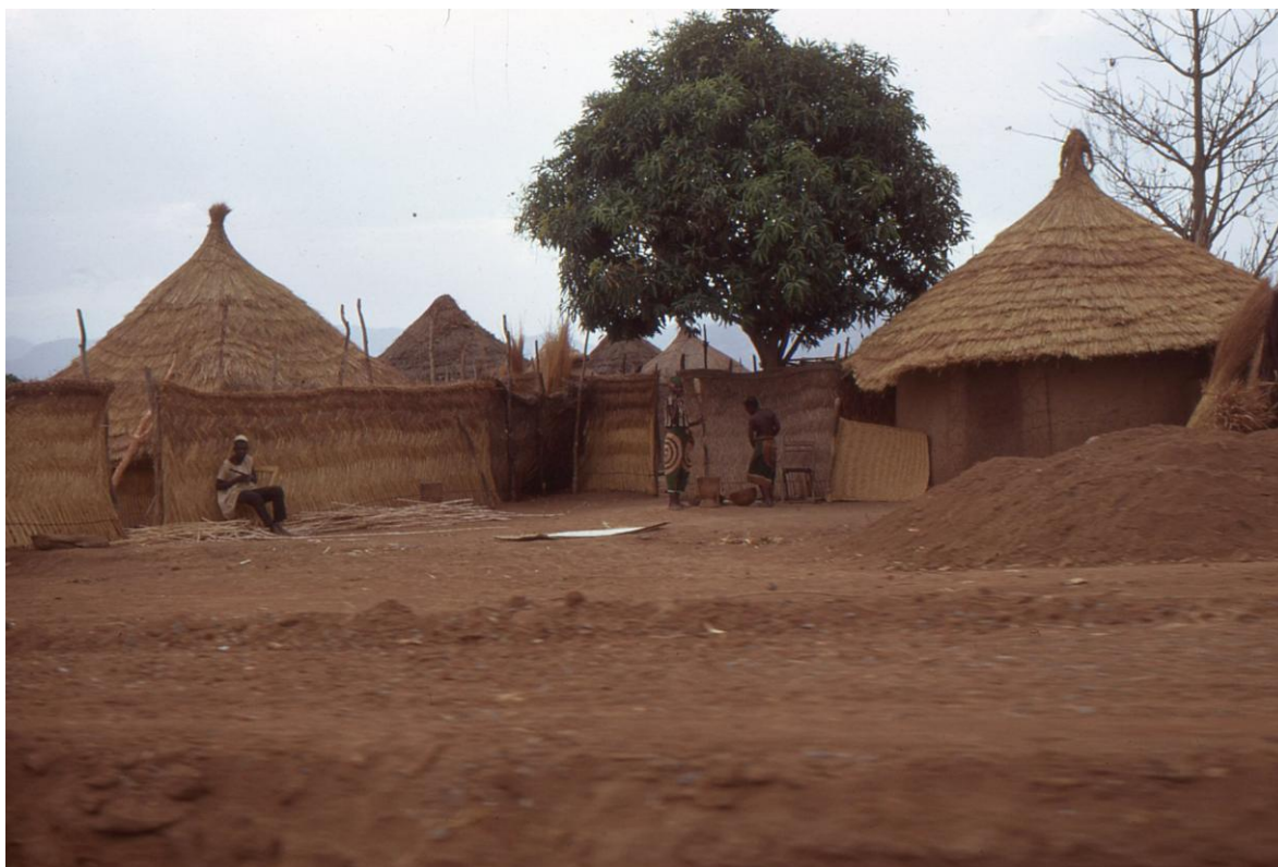
Il Cam 3.15 : village Peul au nord de Ngaoundéré (1974), identifiant la région Nord avec Garoua comme capitale .