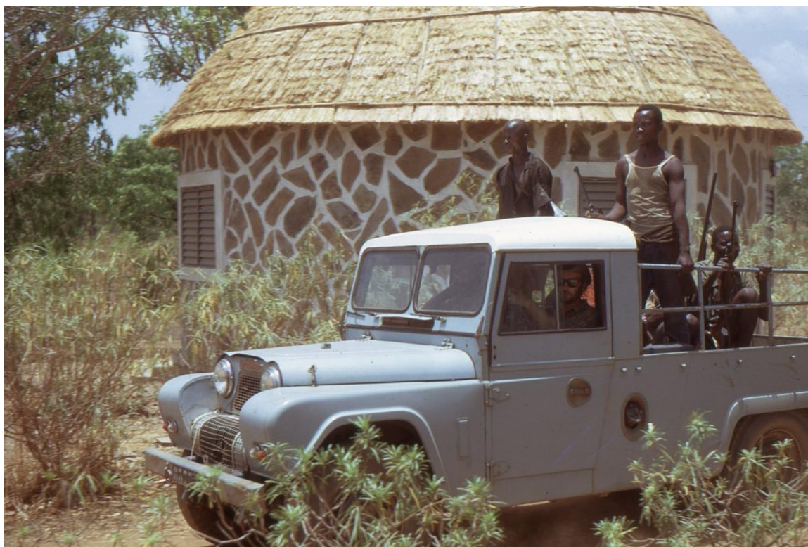
Il Cam 3.04 : parc de La Bénoué (PLB) : « boukarou » au campement du « Buffle Noir » (1974).