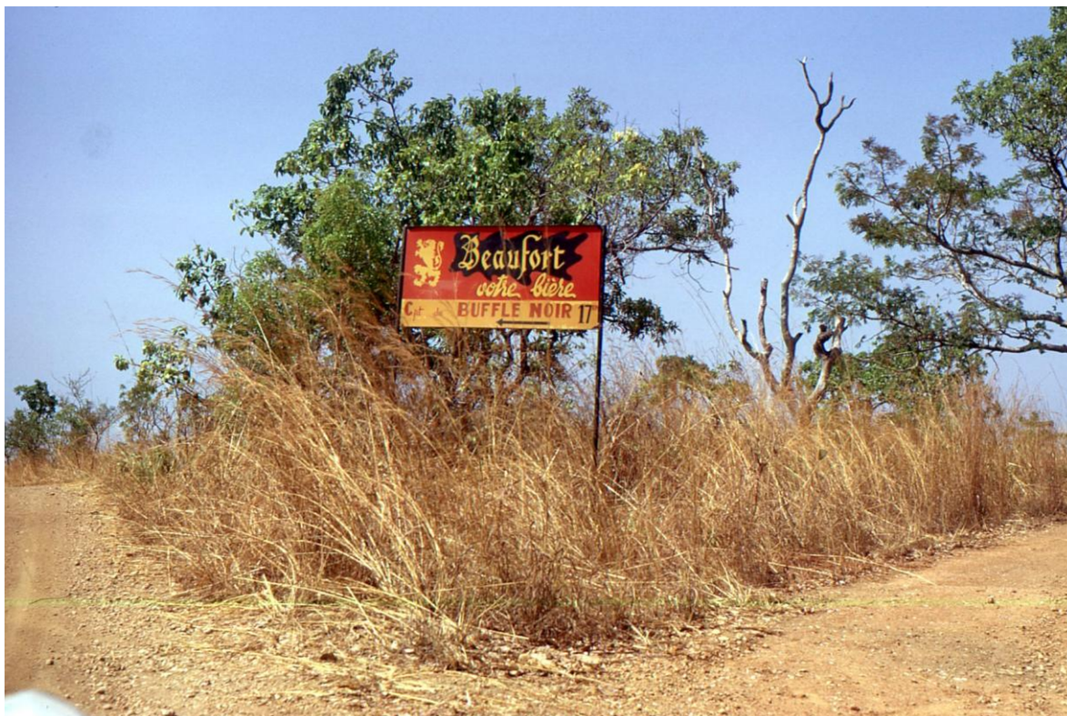
II Cam 3.03 : parc de La Bénoué (département Mayo-Rey, région Nord) : panneau indicateur pour ne pas se perdre et apprécier en même temps, en ces lieux, une bien légitime publicité (1974).