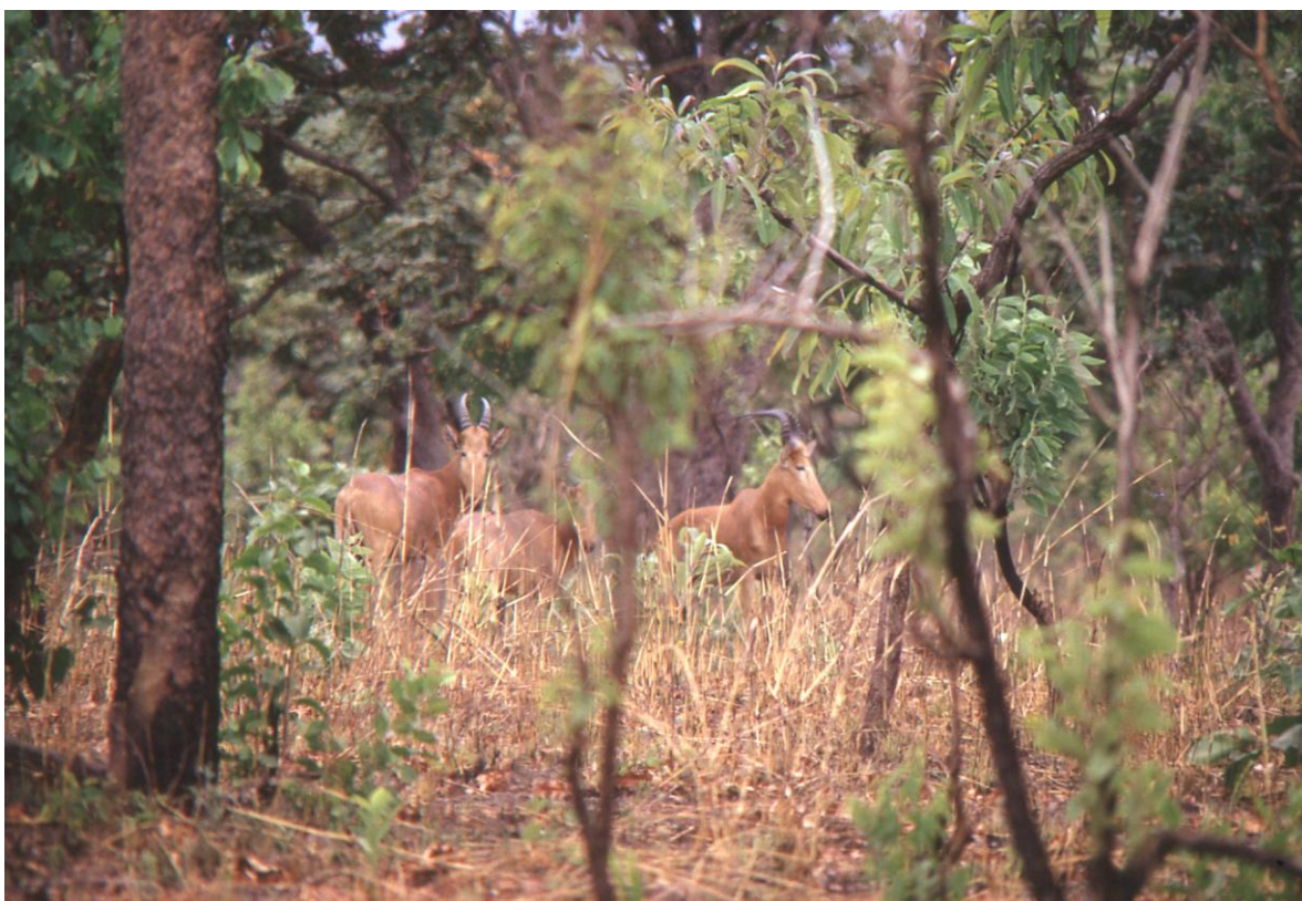
Il Cam 3.09 : bubales roux, parc de La Bénoué (1974).