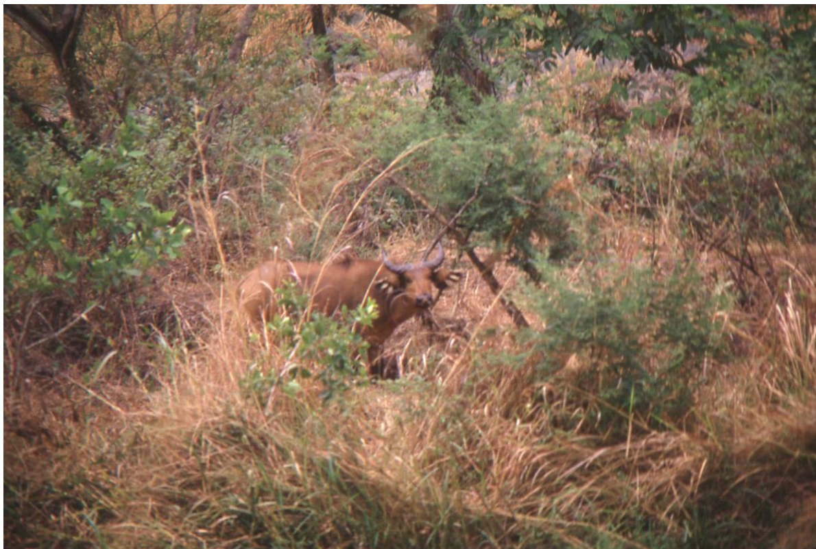
Il Cam 3.10 : buffle, parc de La Bénoué (1974).