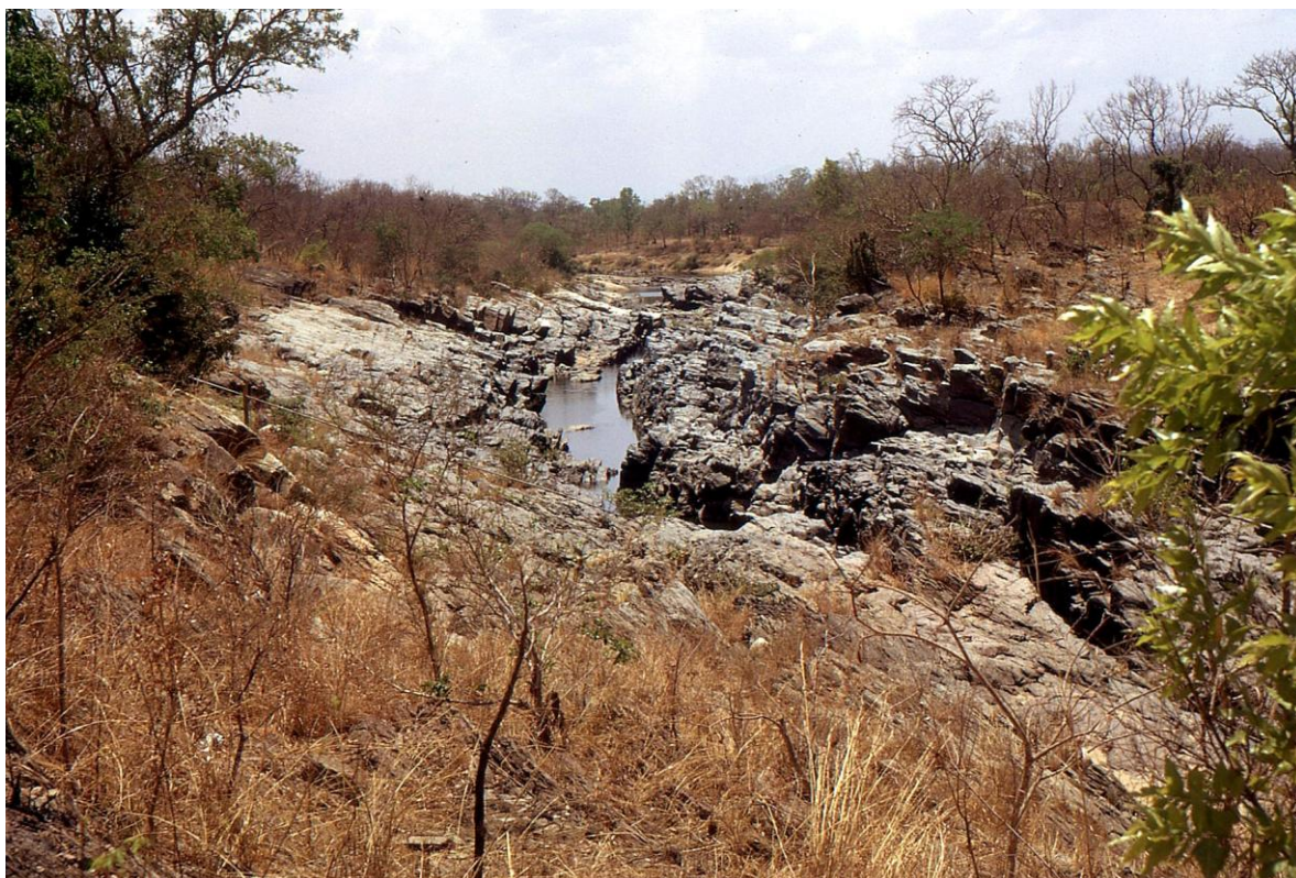
Il Cam 3.06 : « mayo » empruntant une faille basaltique (PLB, 1974).