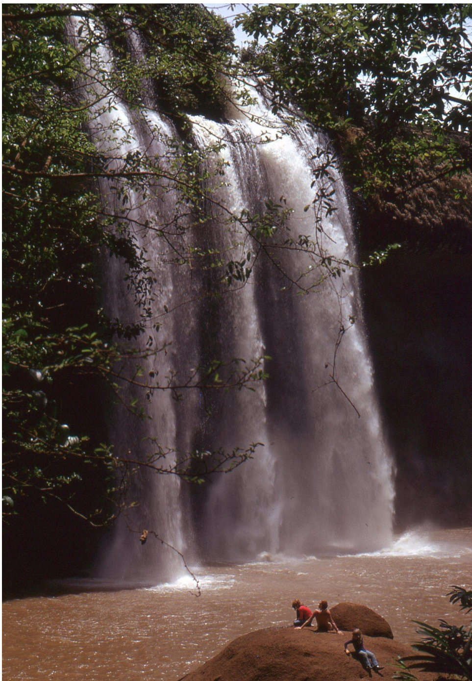
Il Cam 3.12 : chutes de 45 mètres du Tello à l'est de Ngaoundéré (massif de l'Adamaoua) (1974),