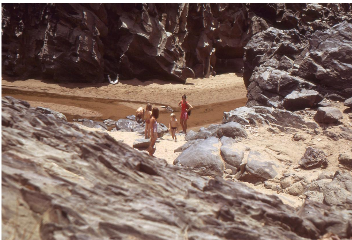
Il Cam 3.07 : petit canyon d'un « mayo » en saison sèche (octobre à janvier), campement du « Buffle Noir » (PLB, 1974).