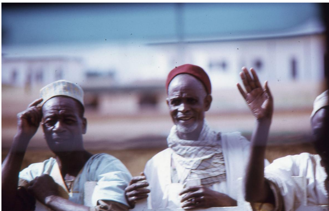
II Cam 3.01 : accueil amical à l'arrivée du train à Ngaoundéré, capitale de la région administrative Adamaoua (1974).

Au final, à l'issue de notre visite, il n'est pas exagéré de dire que ce « nord » (en réalité un petit nord), à cheval sur deux régions administratives limitrophes, Adamaoua et Nord, géologiquement et écologiquement totalement différentes, que ce «nord» donc, s'identifie à une Nature à l'état pure : la beauté préservée des paysages accompagne une existence paisible d'animaux qui n'ont de sauvages que le fait d'être libres.