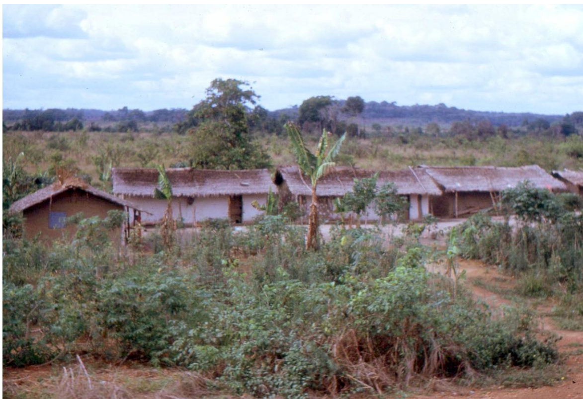
Il Cam 3.16 : village Bantou en plaine au sud de Ngaoundéré (1974), annonçant déjà la région Centre.