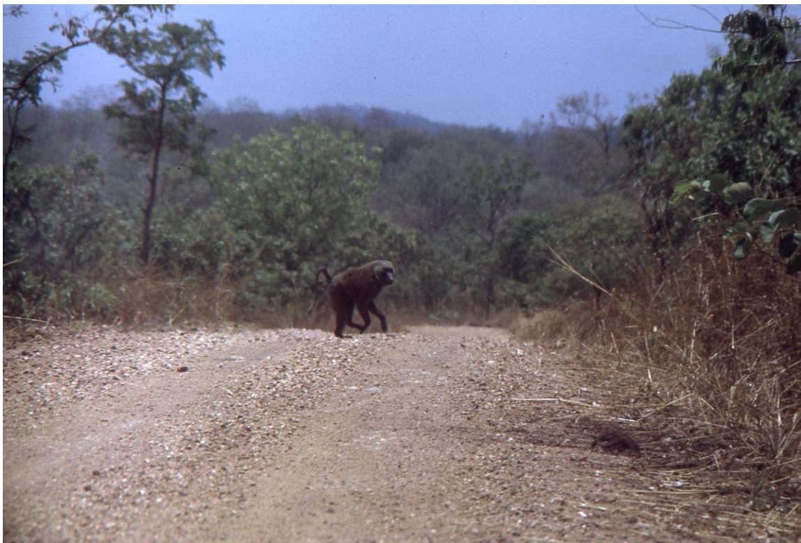
Il Cam 3.08 : Savane arborée et piste à travers le parc de La Bénoué (1974).